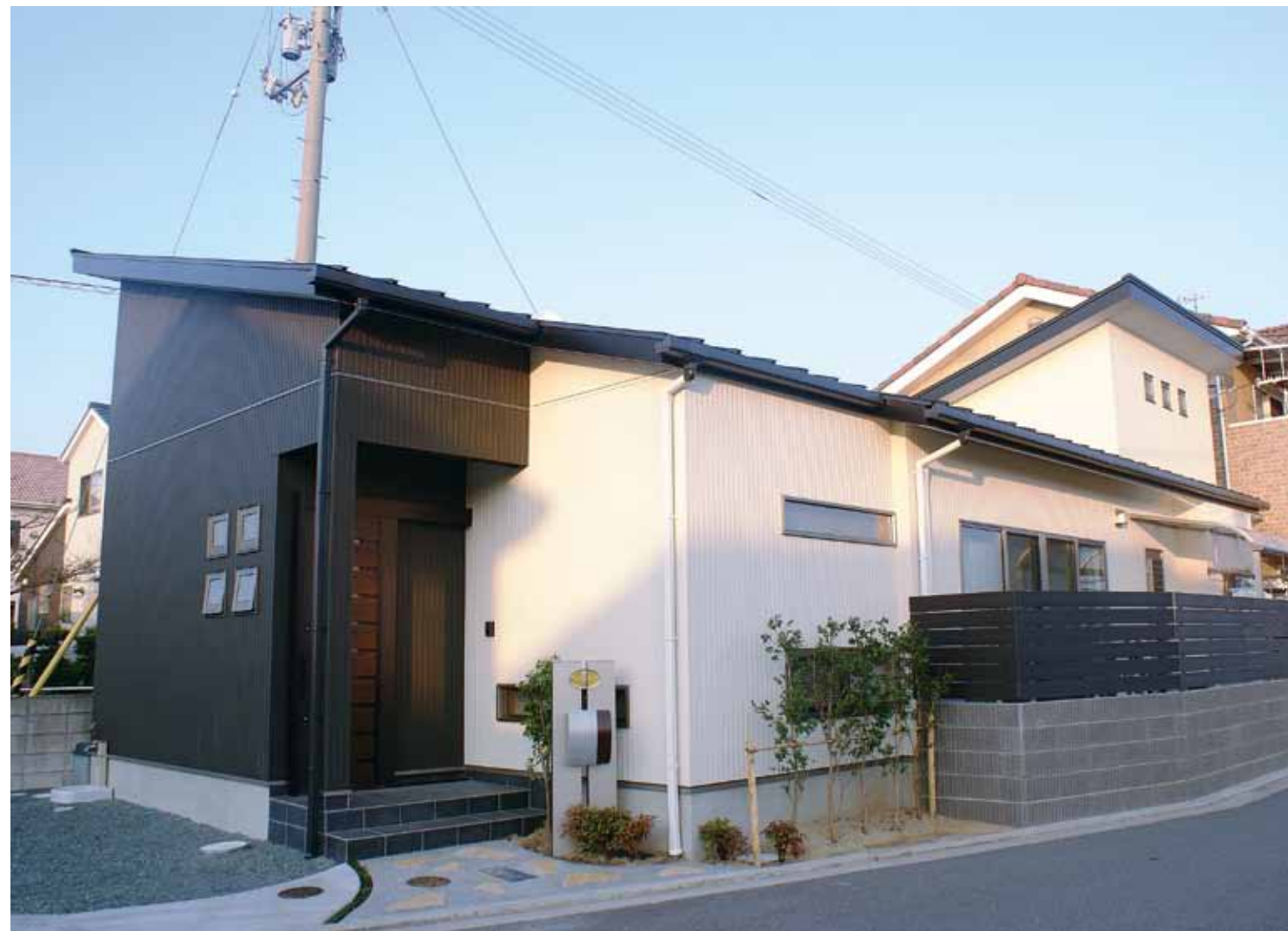
白と黒で張り分けられたスタイリッシュな平屋。