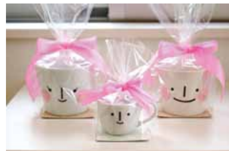
完成お引渡しの際には、姫乃坂カップをプレゼント。