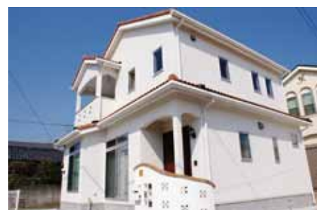
住宅街でも一際目立つ、かわいらしい洋風のお家。