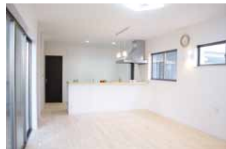
スッキリとシャープに魅せるモダンなLDK。