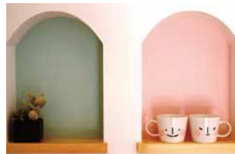
家で飾るニッチも、当社では2つプレゼント。