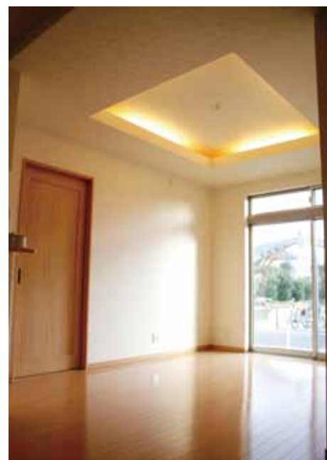
リビングに掘り天井を設けることで、落ち着きのある空間を演出。