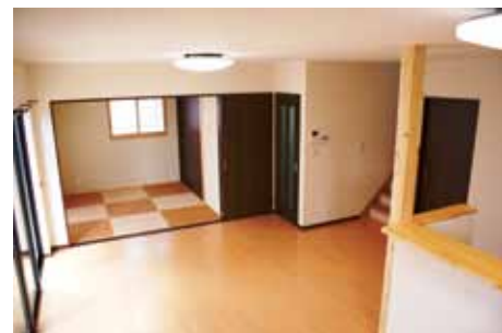
LDKと和室を繋げることで、より広い空間に。