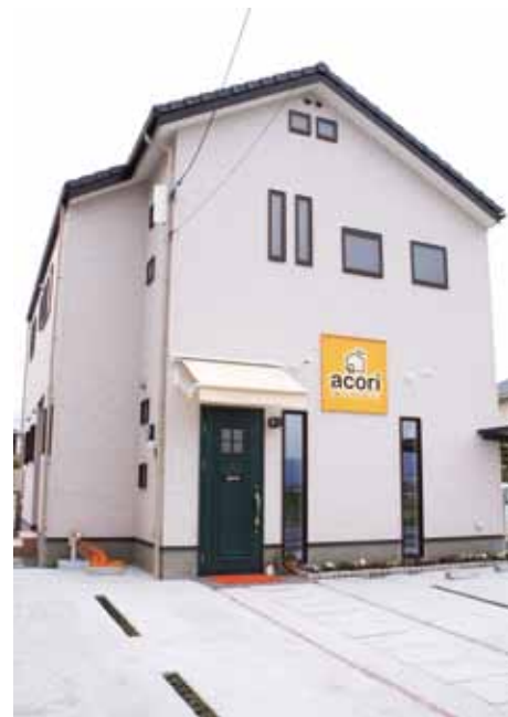
お施主様の夢を叶える、それが姫乃坂建築事務所です。