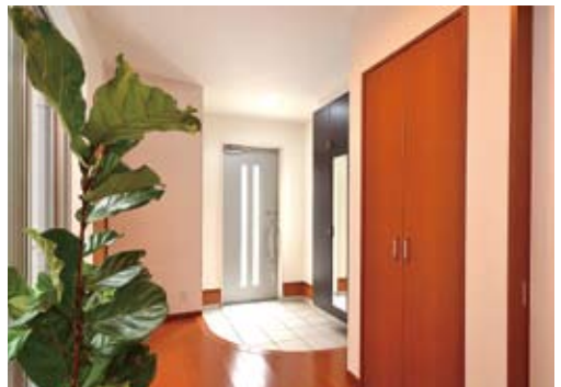
ゆったりと設計された玄関ホール。リビングへと続く廊下も広く、開放感あふれる雰囲気をより引き立てる。