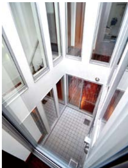
中庭空間の2階部分からも、窓ガラス越しに階下の様子が見える。