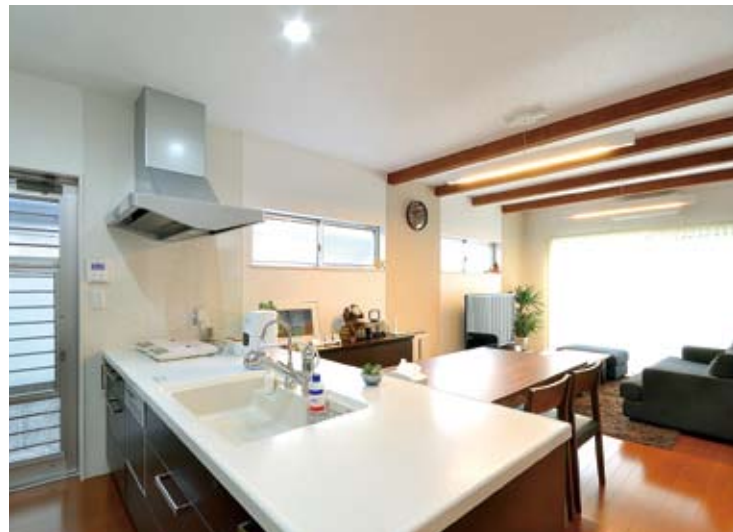
広々としたオープンキッチン。料理を作りながらもリビングの様子がみられるよう、対面型をセレクトした。壁面には大型の食器棚を造作してもらい、使いやすさも抜群。