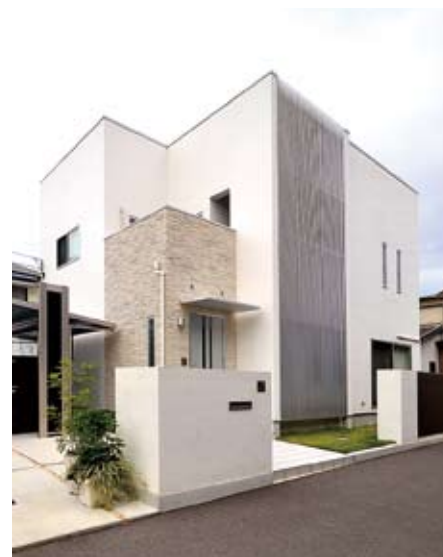
白を基調としたシンプルモダンな外観。縦スリットの格子が外壁のアクセントに。