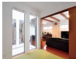
リビングに隣接する畳の部屋。中庭空間に面しているため、明るく開放感がある。