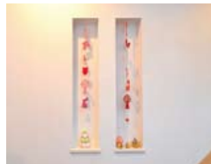
1階の廊下部分にしつらえた縦長のニッチには、かわいい雑貨をディスプレイ。