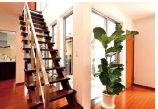
四方ガラス張りの中庭空間とストリップ階段とのコーディネートが斬新なイメージ。