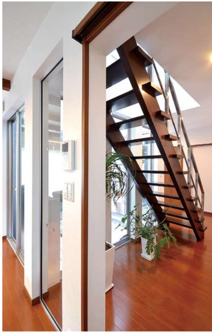
リビング側から見たストリップ階段。階段の隙間から向こう側が見えるので圧迫感がなく、広々とした雰囲気。階段下のスペースは観葉植物を飾るなどして有効活用。